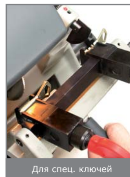
Для спец. ключей

Duo Plus легкий, компактный и удобный в транспортировке.