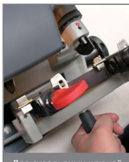
Для сувальдных ключей

Четырехсторонние зажимы позволяют нарезать практически все плоские ключи, имеющиеся на рынке. Двух/трехсторонние вращающиеся зажимы для сувальдных ключей с имеют специальную систему фиксации для ключей типа Abus® и Abloy®.