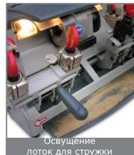
Освещение лоток для стружки