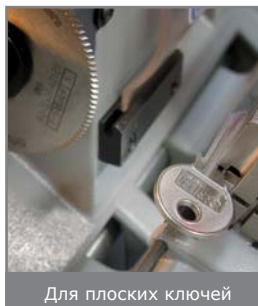
Для плоских ключей