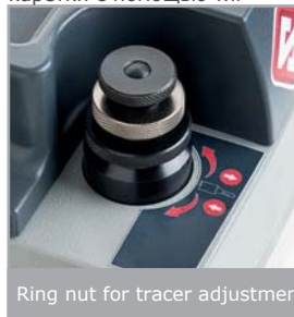
Ring nut for tracer adjustment

Рычаги и ручки станка изготовлены из инженерной пластмассы и, благодаря своей эргономичной форме, обеспечивают удобный захват и управление. Перемещение каретки с помощью тяг