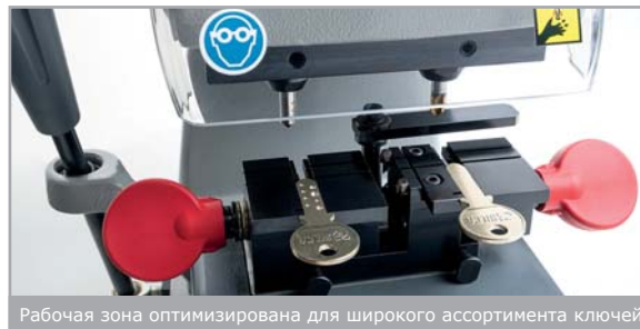
Рабочая зона оптимизирована для широкого ассортимента ключей

Подача фрезы гладкая и без люфтов для получения точных результатов обработки ключей.