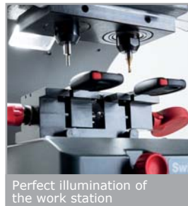
Perfect illumination of the work station

Отсек для принадлежностей, позволяющий легко добраться до наиболее часто используемых инструментов. Безопасно для мастера Сетевой выключатель станка - термомангнитный, предохранительное устройство, которое предотвращает автоматическое включение фрезы после внезапного прерывания работы и повторного включения электроэнергии.