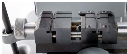
Сменные губки на тисках