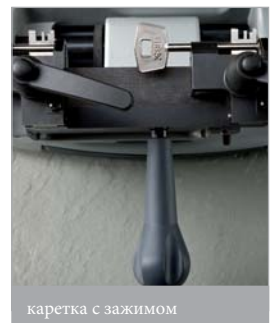
каретка с зажимом

Изготовленный исключительно из отборных материалов и компонентов, он предназначен быть долговечным инструментом в вашем бизнесе по изготовлению ключей, что гарантируется маркировкой CE.