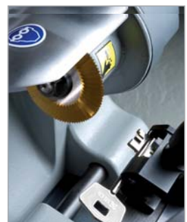
фреза из быстрорежущей стали (HSS) с покрытием TiN